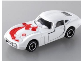
「天」 トヨタ 2000GT