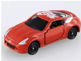
「喝」 日産 フェアレディZ