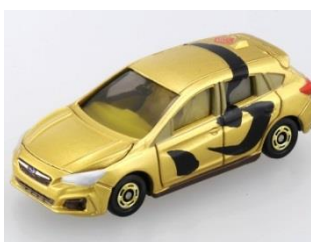
「心」 スバル インプレッサ スポーツ モデル