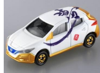
「夢」 日産 リーフ