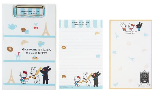
ミニバイダー&メモ 10本 サイズ：バイダー 約横 12.5×縦 20cm メモ 2柄各 15枚入