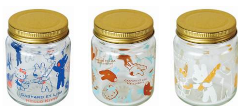
小瓶セット 10本 サイズ：各約直径 6×高さ 7.5cm 3個入り