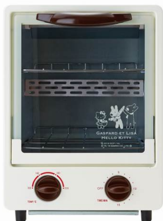
トースター 2本 2段階 サイズ：横 23×縦 31×奥行 26cm