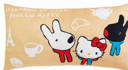
ラストスペシャル賞：クッション 最後の1個のくじを購入された方にプレゼント サイズ：約横 60×縦 30cm