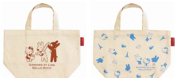
ミニバッグA 6本 ミニバッグB 6本 サイズ：約横 32×縦 20×マチ 11.5cm