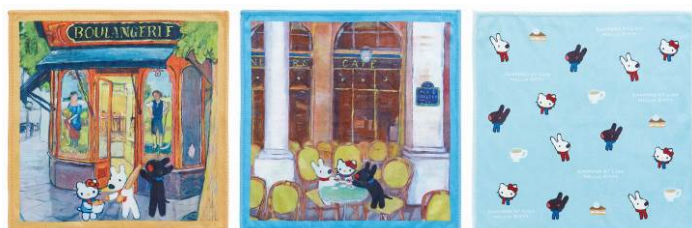
プチタオルセット 10本 描き下ろし絵を含む3デザインのプチタオル3枚セット サイズ：各約横 30×縦 30cm