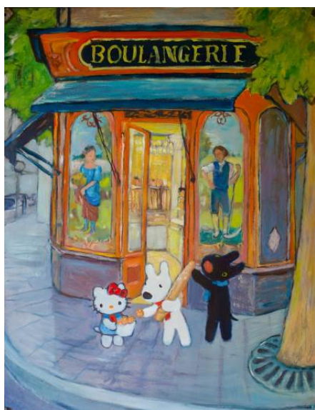
作品名：パン屋さんでお買い物（左）