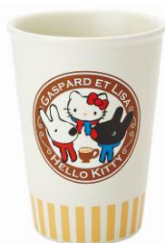
陶磁器製カップ 10本 サイズ：約直径 8×高さ 10.5cm