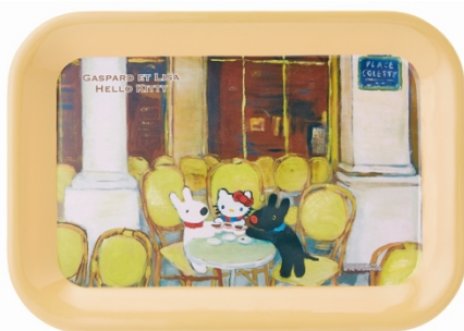
トレイ 10本 描き下ろし絵を使用したトレイ サイズ：約横 29.8×縦 21cm