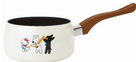
ミルクパン 2本 IH対応の片手鍋 サイズ：約直径 16×高さ 8cm