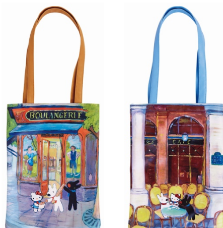
トートバッグA 2本 トートバッグB 2本 リサとガスパール作者とハローキティ担当デザイナー 描き下ろし絵を使用したフラットトート サイズ：約横 28×縦 36cm